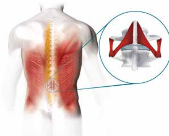
Segmentale Muskulatur Das Rückgrad Ihrer Wirbelsäule

Die innovativen Metzeler Air-Channels sorgen für eine perfekte Luftzirkulation.