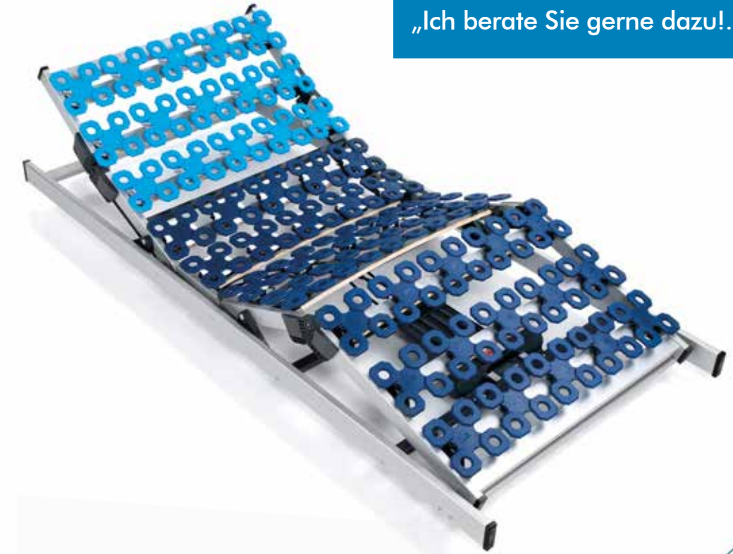
Die AirLine-aktiv Unterfederung mit Flachmotor