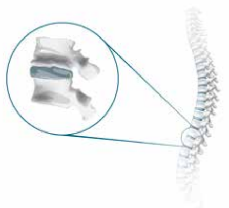
Wirbelsegment Stoßdämpfer der Wirbelsäule

Ohne Abbildung: Ausführung 2-motorig Optional: Unterfederungen mit Motor auch mit Funkfernbedienung erhältlich